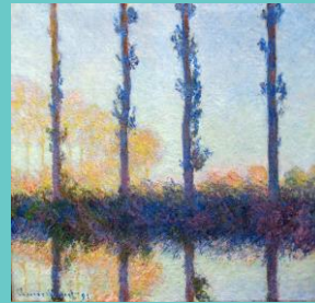
The Four Trees, 1891

Claude Monet was born in Paris, France, and is famous for being one of the founders of Impressionism. Impressionism is an artistic style that is characterized by short, spontaneous brush strokes, thick paint, and vibrant colors that create the ide, or impression of a subject, rather than focusing on exact shapes and details. He was especially interested in the effect of the changing light on shadows, color, and mood of the subject. How does the morning sunlight look different from the light at noon? At sunset? Think about this today as you paint birch trees in the Impressionist style!