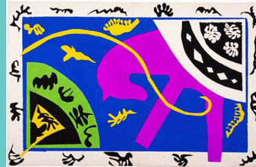
The Horse, the Rider, and the Clown (1947)

Henri Matisse nació en Francia en 1869. Él es conocido por hacer arte brillante utilizando varios tipos de materiales. Su carrera en arte empezó primero con pinturas y después extendió a trabajo de bronce y luego grabados. El trabajo posterior de Matisse fue hecho cortando papel brillante en figuras diferentes como animales, hojas, flores, y figuras abstractos, colocándolas en hojas grandes de papel. Hoy, vamos a recortes de papel para crear collages como Matisse.